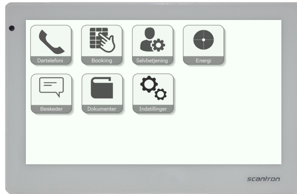
Eksempel på NovaDrive® menu på AT7 lejlighedsterminalen